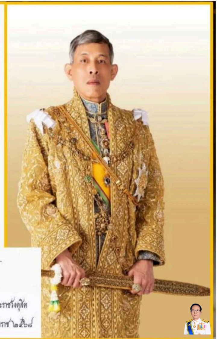
พระที่นั่งอัมพรสถาน พระราชวังดุสิต วันที่ ๑๘ มีนาคม พุทธศักราช ๒๕๖๘

การปฏิบัติราชการนั้น ไม่ว่าจะป็นงานส่วนใด ในตำแหน่งหน้าที่ใด ก็ล้วนมีผลต่อชาติบ้านเมืองและประชาชน ทั้งสิ้น. ข้าราชการทุกฝ่ายทุกระดับ ไม่ว่าจะทำการใด จึงต้องคิดให้ดี ให้รอบด้าน โดยคำนึงถึงผลที่จะเกิดขึ้น ทั้งในระยะสั้นระยะยาวเสียก่อน แล้วปฏิบัติงานทุกอย่าง ให้ถูกต้องเหมาะสม ด้วยสติปัญญาความสามารถ และใจที่สุจริตเป็นธรรม.